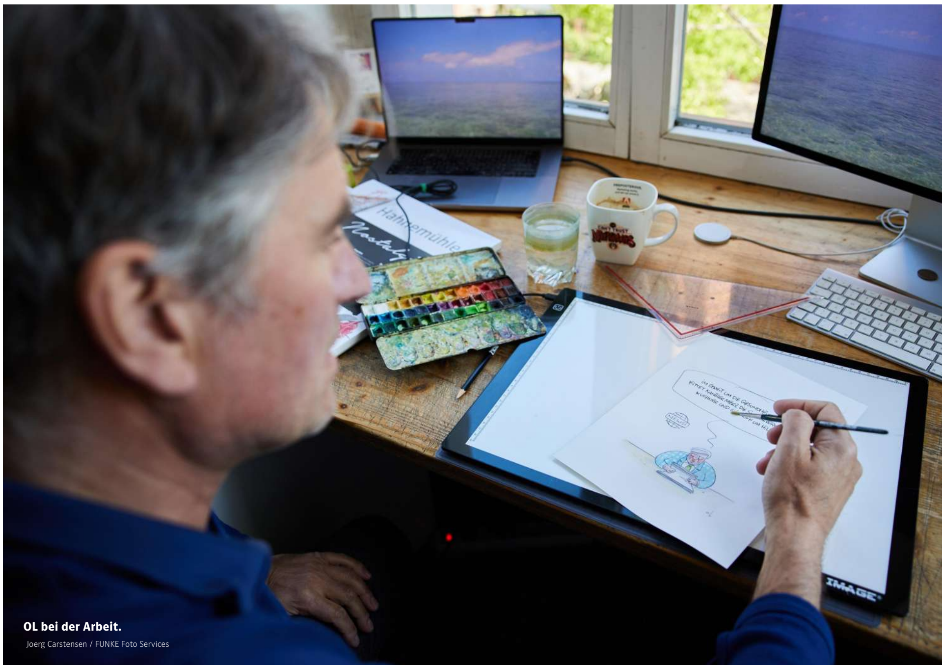
OL bei der Arbeit.

Ich hatte schon in der zehnten Klasse Ärger mit der Schulleitung wegen meines Schwerter-zu-Pflug-scharen-Aufnähers bekommen. Die waren für die DDR-Behörden ein rotes Tuch. Ich habe immer eine große Klappe gehabt. Meine Schuldirektorin hat mich dann mal aus dem Unterricht geholt. Ich musste in einen kleinen Raum, da saß so ein Typ. Es ging dann gar nicht darum, was ich gemacht hatte. Der wollte mich anwerben. Ich sagte ihm, ich hätte keine Freunde, ich sei ein Einzelgänger. Irgendwann hat er nochmal Kontakt aufgenommen, ich habe ihn in Potsdam getroffen und wieder abge-